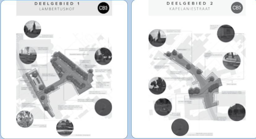
De gebiedsontwerpen voor de twee deelgebieden die het Nederweertse centrum een stevige impuls moeten geven.