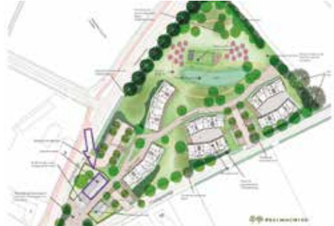
Bovenaanzicht van plan Peelwachter met een pijl is de nieuwe locatie van de Huisartsenpraktijk Ospel aangegeven.

Tot de verhuizing Waatskamp 4 Tot de verhuizing blijft de praktijk aan de Waatskamp 4 in Ospel open. Dokter Wilbert Sluiter blijft samen met een nieuwe vrouwelijke collega het vaste aanspreekpunt. De patiënten die ingeschreven staan bij de praktijk hoeven zich niet over te laten schrijven en verhuizen automatisch mee. Het team van de groepspraktijk is dankbaar voor alle jaren dat Ineke Husaarts zich heeft ingezet voor de praktijk en voor Ospel.