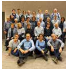
Heart & Soul

Voor of na afloop kan je heerlijk struinen door de winkel van het buitencentrum. Hier vind je (natuur) boeken, streekproducten en souvenirs. Voor een hapje en drankje kan je in de Peelkiosk terecht. Het buitencentrum is elke dag geopend van 10.00 tot 17.00 uur. Meer informatie: www.staatsbosbeheer.nl/depelen of neem contact op met het buitencentrum via: depelen@staatsbosbeheer.nl of telefonisch: 0495 - 641 497.