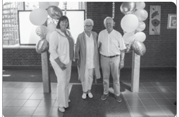
Het diamanten paar op de foto met de burgemeester.

paar te feliciteren met deze mooie mijlpaal. We feliciteren de heer en mevrouw Konings van harte met hun 60-jarig huwelijk en we wensen hen nog vele gelukkige jaren samen.