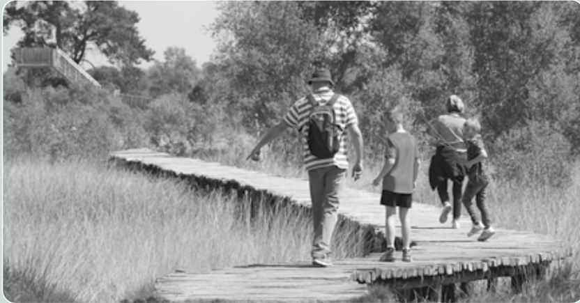
Nationaal Park De Grootte Peel is een belangrijk toeristisch speerpunt voor onze gemeente.