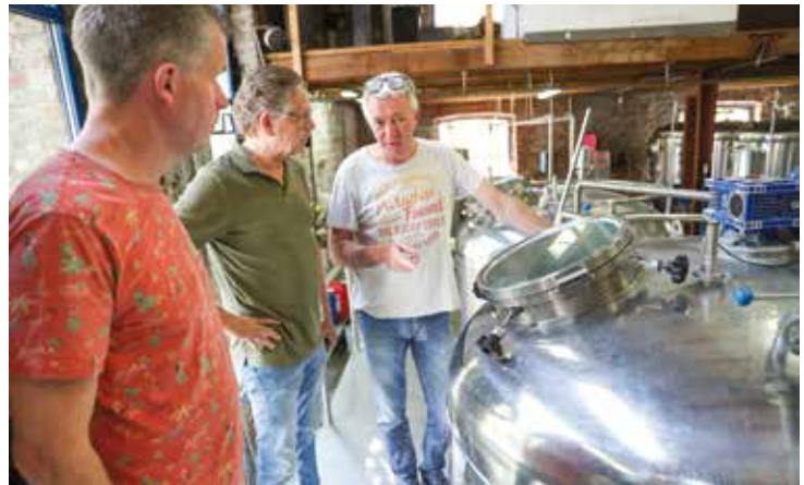
in de Brouwschuur in Weert.

Openluchtspel Beleef het mee en kom dus allen op donderdagavond 13 juli om 19.30 uur