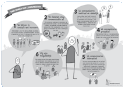
De nieuwe communicatievisie is samengevat in een handig overzicht. Afbeelding: gemeente Nederweert.

6. We zijn toegankelijk We maken onze informatie beschikbaar en bereikbaar voor iedereen en u kunt ons op allerlei manieren benaderen om vragen te stellen, ideeën te delen, tips te geven. Bijvoorbeeld via de website, via Facebook, via email en via telefoon.