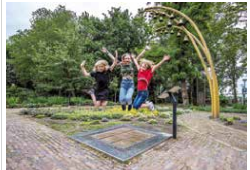
Kinderen op het springcarillon in de museumtuinen van Museum Klok & Peel