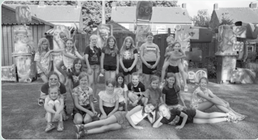
Een aantal meiden van Jong Nederland Budschop die meehielp poseert voor een deel van de kunstcreatie.