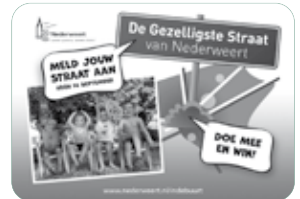
Welke straat wordt het dit jaar en gaat er met de trofee van door?

gaan doen en waarom jullie de prestigieuze titel en wisseltrofee zouden moeten winnen.