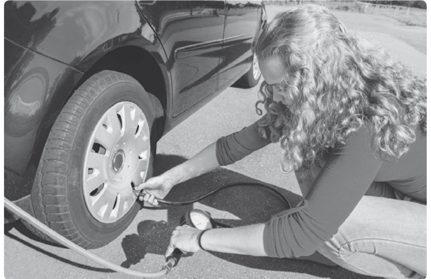
Je autobanden oppompen, kleine moeite maar beter voor je portemonnee én het milieu.