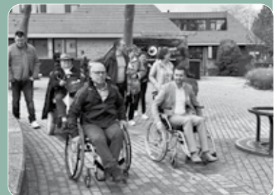
Het gezelschap startte met de wandeling bij het gemeentehuis.

Tijdens de wandeling werd een aantal locaties bezocht die voor mensen met een verstandelijke of fysieke beperking een uitdaging kunnen zijn. Denk aan een hoge stoep, obstakels of onoverzichtelijke zichtlijnen. Samen werd geconstateerd dat het in Nederweert best goed geregeld is, maar dat er op sommige plekken ook nog verbetering wenselijk is.