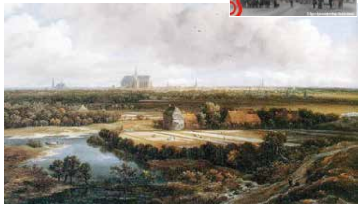
Gezicht op Haarlem en de blekersvelden. Honderden Weertlanders trokken hier in de 18e eeuw naar toe om er zich permanent te vestigen.