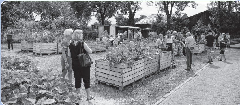
Er komt geld beschikbaar voor leefbaarheidsinitiatieven op het platteland. Bijvoorbeeld voor de aanleg van een pluuktuin, mits deze aan de geldende voorwaarden voor de subsidie voldoet.