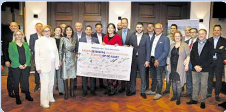
Bestuurders van de zeven Midden-Limburgse gemeenten tijdens de presentatie van de Regio Deal-aanvraag in oktober vorig jaar.