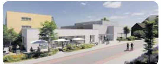
De voorzijde van de nieuwe Pinnenhof.

Op 1 april sluit het huidige Pinnenhofgebouw voorgoed haar deuren en verhuizen de verenigingen naar de tijdelijke huisvestingslocaties. Na de zomer starten de sloopwerkzaamheden. De bouw van de nieuwe MFA zal, naar verwachting, tot einde 2025 in bestag nemen.