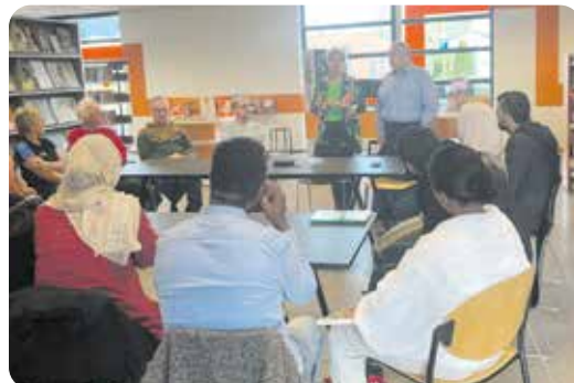
Inburgeraars van verschillende nationaliteiten ondertekenen hun participatieverklaring.

Op donderdag 21 maart ondertekenden een aantal inburgeraars uit onze gemeente de participatieverklaring in het Bibliotheek in Nederweert. Wethouder Carla Dieteren reikte de verklaringen uit.