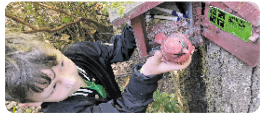
Schatten vinden is leuk en leerzaam.

Ben je enthousiast geworden? Kijk dan op nederweert.nl/geocaching voor meer informatie en de schatten in ons buitengebied. Happy hunting!