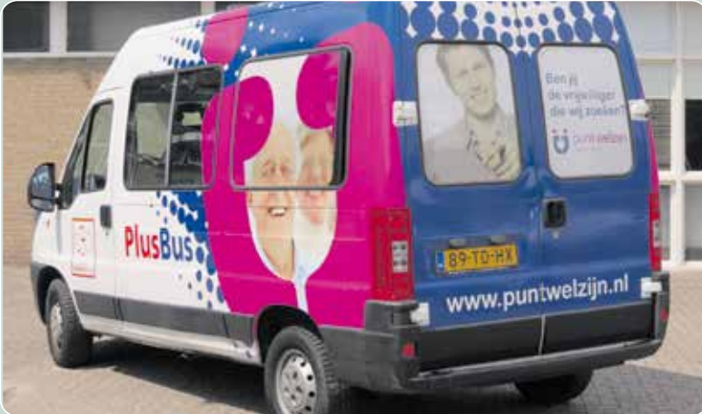
Boodschappen doen, een uitstapje maken of vrijwilliger worden? Het kan allemaal met de BoodschappenPlusBus vanaf vrijdag 10 mei.