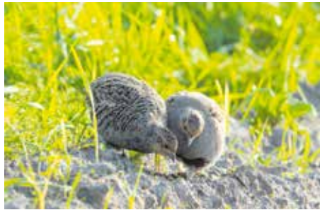
De patrijshen (links) krijgt in de broedtijd een perfecte schutkleur. De bruine veertjes op rug en hals maken de hen onzichtbaar op het nest.

Mei en juni zijn de maanden van de waarheid voor de patrijs. Ze zijn nu aan het broeden en moeten absoluut met rust gelaten worden.