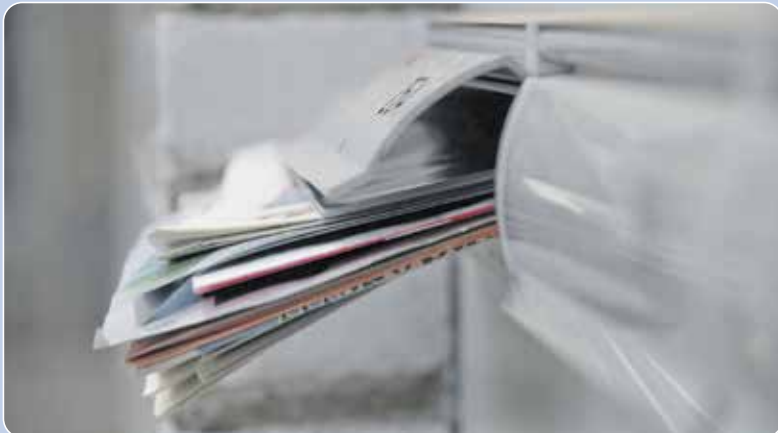
Zorg voor een bewoonde indruk als u op vakantie gaat, o.a. door de brievenbus te laten legen.