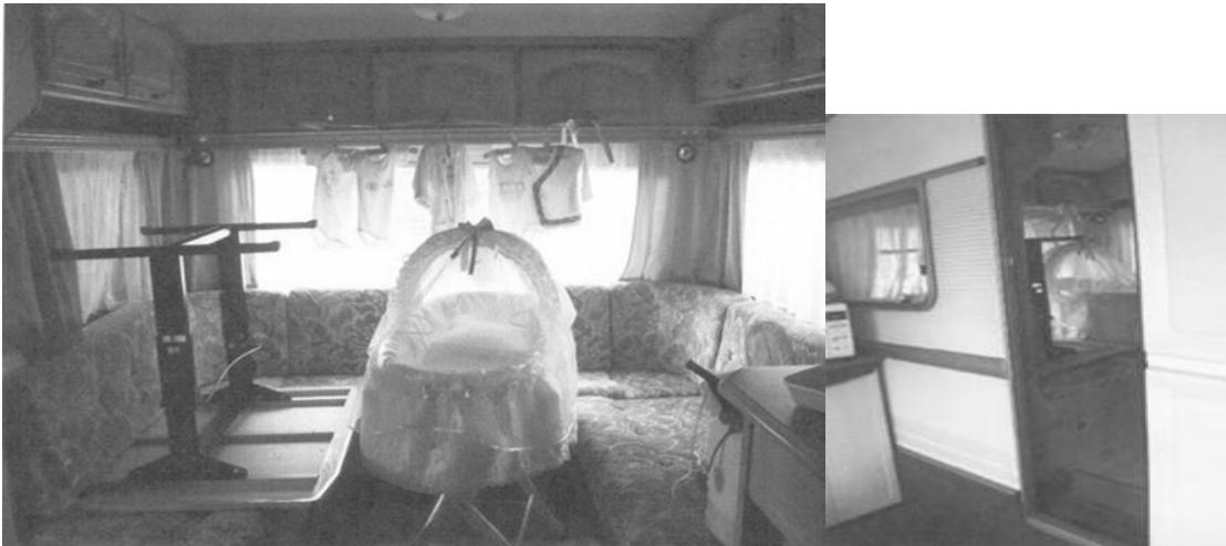
Het wiegje van onze oudste in de toercaravan 2012

Waar woon ik en hoe lang al? Ik woonde als kind en jongvolwassen vrouw bij mijn ouders in de woonwagen aan de Gutjeszijweg in Budschop. Ik ben gewoon naar school gegaan en heb een vakopleiding gevolgd. Mijn man komt uit Weert en heeft ook vakopleidingen gedaan. Toen wij verkering kregen in 2003 werd het snel een serieuze relatie. Wij zijn toen in 2005 standplaatsen gaan aanvragen. Die zouden voor ons gerealiseerd worden eind 2008 begin 2009. Doordat dit niet het geval was en we wilden gaan samenwonen ben ik in 2009 gedoogd door de gemeente in een toercaravan gaan wonen tegenover mijn ouders op het kamp. Ik kreeg geen stroom, had geen stromend water, geen riolering. Emmers water sjouwen, alles doen bij mijn ouders. We hebben zelf een (gedoogd) aanbouwtje gemaakt aan de toercaravan waar we een soort van keukentje maakten, want toen wij trouwden woonden we samen in de toercaravan. Dat was eigenlijk al ondoenlijk. Onze eerste is geboren in 2012. Vanuit mijn kraambed moest ik naar de overkant bij mijn ouders naar het toilet, douchen en de was doen. Het wiegje met de baby stond aan ons voeteneind.