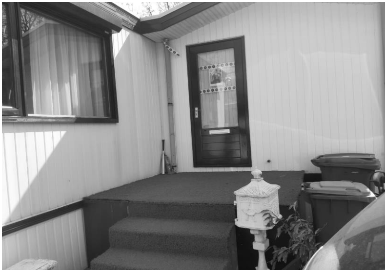
Ingang met vuilnisbakken 1