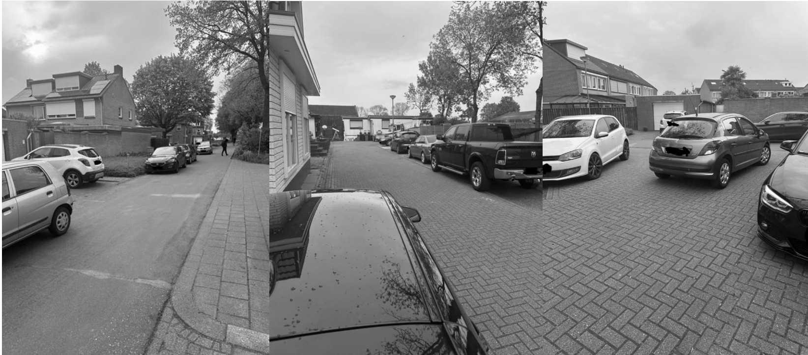
Parkeerproblemen op de Gutjesweg.