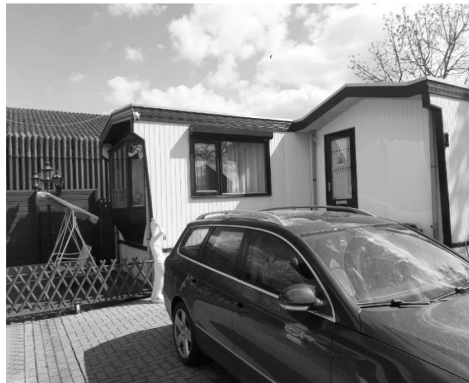
Geen speelruimte voor mijn kids 1