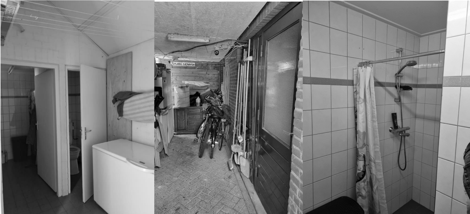
In het schuurtje douchen de mannen en doen wij de was, het is erg vochtig en beschimmeld.