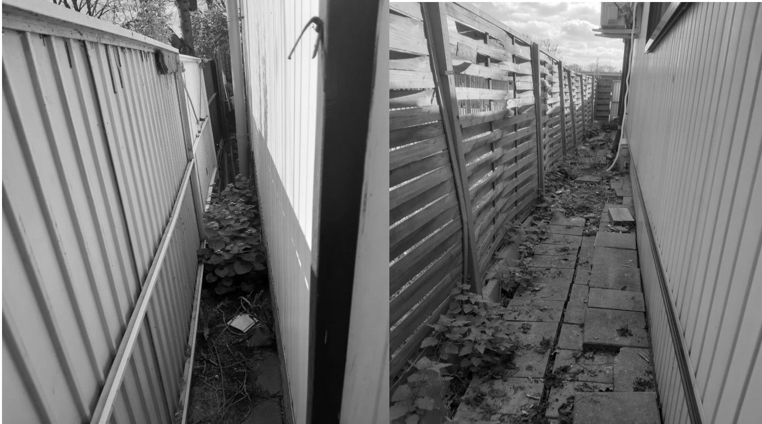
Brandgang Gemeentewerf aan de zijkant van mijn wagen