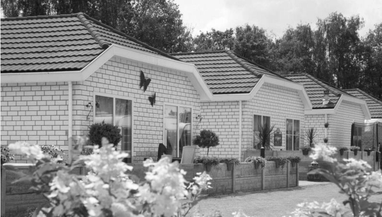
Zo zou het moeten zijn