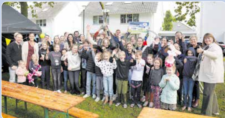
De bewoners van Hoge Notte wonen aan De Gezelligste Straat van Nederweert 2024.