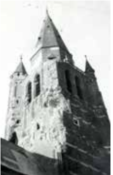
Zware beschietingen door de Duitsers vanuit Ospel en Eind ten einde de St. Lambertustoren te vernietigen, leidden tot grote schade. Foto uit 1945, toen men begon met het dichten van de gaten in de torenspits.

Authentiek De teksten van Jean Bruekers, geschreven in potlood en met vulpen in tientallen schoolschriften, worden hieronder zoveel