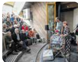
Peelpodium muziekband Sakkerdju