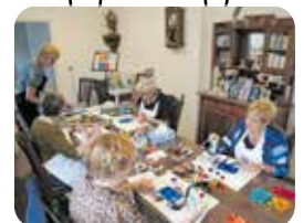
Unieke kaartjes maken