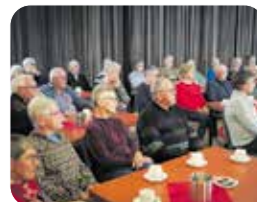
Informatiemiddag sociale veiligheid