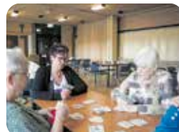
Kaartmiddag in Budschop