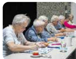
Kienen in Nederweert