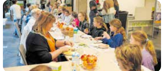
Samen gezond ontbijten voor een goede start van de dag.

Het ontbijt werd verzorgd en geleverd door het Nationaal Schoolontbijt dat jaarlijks wordt georganiseerd om het belang van gezond ontbijten, elke dag en voor ieder kind, onder de aandacht te brengen.