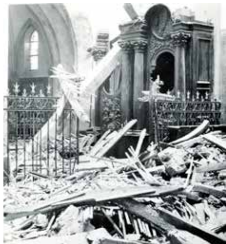
Zware verwoestingen in de noordbeuk van de St. Lambertuskerk, veroorzaakt door neerstortend puin van de kerktoeren.