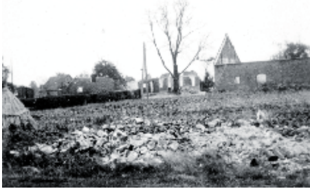
Door de Duitse troepen in brand gestoken boerderijen in de omgeving van Uliker en Winnerstraat.

Het is de laatste week van oktober 1944. Veel inwoners van Nederweert-Dorp en ook het gezin van smid Bruekers zijn naar Weert gevlochten en de dorpskern is een spookdorp geworden. Terwijl ongeorganiseerde groepen vluchtelingen met ouden van dagen, zieken en kinderen van Nederweert naar Weert trekken, rijden honderden Amerikaanse tanks en pantserwagens in omgekeerde richting in twee rijen dik naar Boeket en Nederweert-Dorp. Niet eerder hebben de Nederweertenaars zoveel zwarte Amerikanen gezien. Vanaf het tijdelijke Amerikaanse vliegveld dat op Laar is aangelegd worden aanhoudend aanvalsvluchten op Ospel uitgevoerd. De daar gelegerde Duitsers steken 14 boerderijen aan de Winnerstraat in brand. De toren van de St. Lambertuskerk wordt aanhoudend beschoten met granaatvuur, in een poging deze geallieerde uitkijkpost te vellen. Alle enkele gevulde Nederweertenaars met gevaar voor eigen leven even terugkeren naar Nederweert om het vee te voederen, doen zij een bizarre ontdekking. Achtergebleven inwoners hebben zich van hun zwartste kant leren kennen door de huizen van gevulde dorpsgenoten te plunderen. Sommigen worden op herterdaad betrapt.