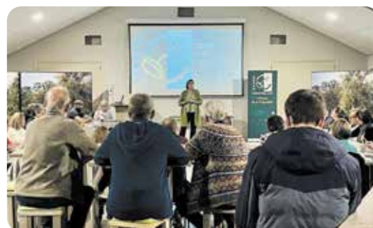
Samen in gesprek over de mogelijkheden van LEADER.

Wilt u een extra exemplaar? Dan kunt u dit afhalen aan de balie in het gemeentehuis.