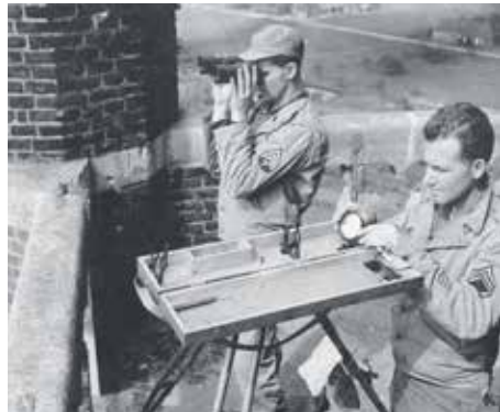
Amerikaanse militairen op de zwaarbeschadigde St. Lambertustoren bekijken de Duitse krijgsverrichtingen aan de overzijde van het kanaal.

E-mail: repaircafenederweert@telfortglasvezel.nl facebook: Repair Café Nederweert