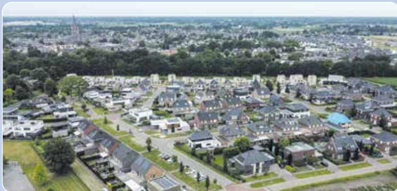
Onverminderd inzetten op een verdere versnelling van de woningbouw.