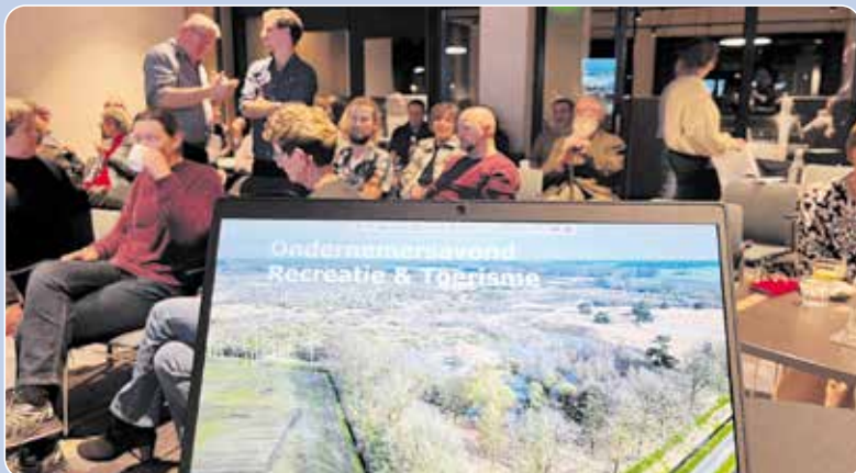
De halfjaarlijkse ondernemersavond draagt bij aan het verstevigen van het ondernemersnetwerk in de toeristische sector.