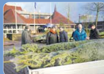
Drukte en gezelligheid tijdens het ophalen van maar liefst 32 buurtbomen.

Om een leuk beeld te krijgen van de versierde buurtbomen, roepen we de ontvangers op om een foto van de boom te mailen naar buurtboom@nederweert24.nl. De foto's worden verzameld om er een leuke collage van te maken. Tijdens de kerstdagen zijn de foto's op de website van Nederweert24 te zien.