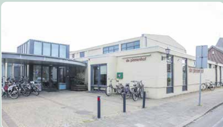
Raadsleden werden uitgenodigd om met elkaar van gedachten te wisselen over de uitgangspunten voor nieuwe Pinnenhof-varianten.